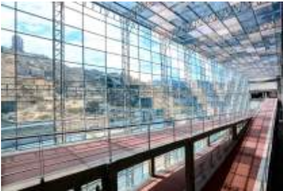
Campo Ferial Chuquiago Marka – Pasarela