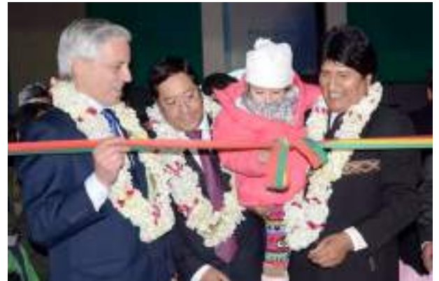
Inauguración Campo Ferial Chuquiago MARKA