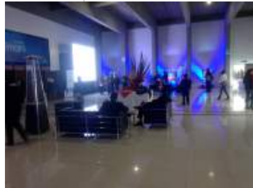
Campo Ferial Chuquiago Marka – Antesala Auditorio Illimani