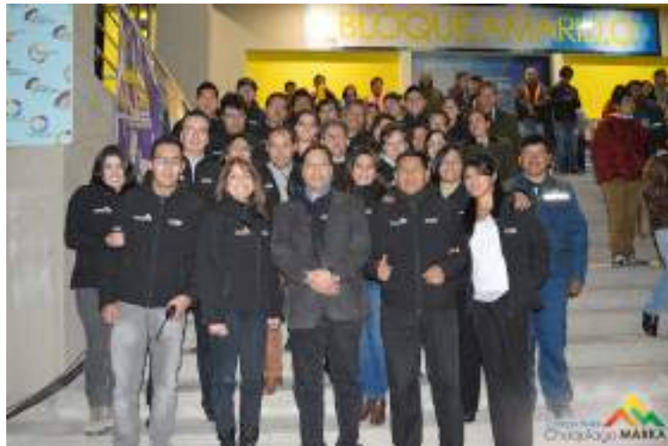
Ministro de Economía y Finanzas Públicas con el personal de la UCPP