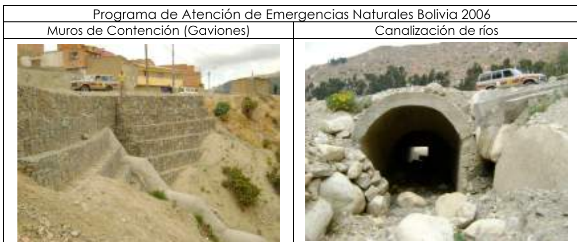
Ilustración: Programa de Atención de Emergencias Naturales Bolivia 2006