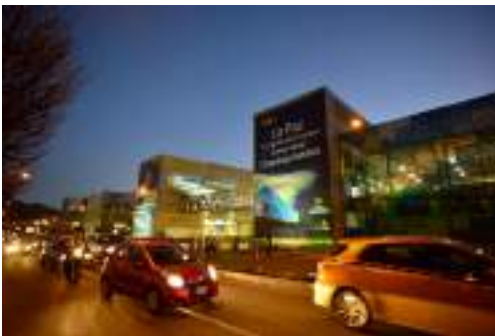
Campo Ferial Chuquiago Marka – Frontis