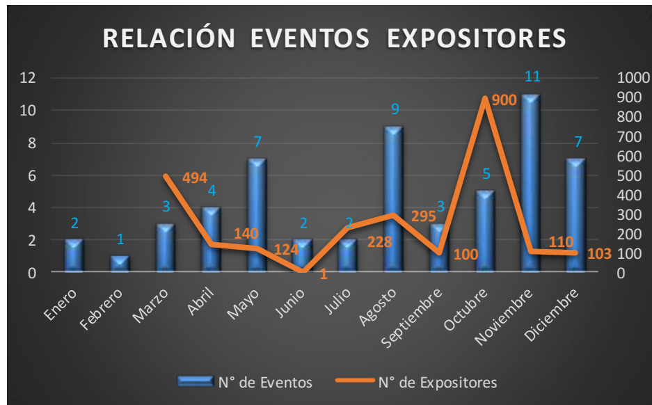
Gráfico 1 Eventos y Expositores por mes